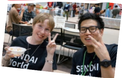
こくさいこうりゅう 国際交流 Multicultural Exchange

(公財) 仙台観光国際協会 (SenTIA) 内 〒980-0804 仙台市青葉区大町2丁目2-10 仙台青葉ウイングビルA棟11階 TEL:022-268-6260 FAX:022-268-6252 E-mail: senfesinfo@gmail.com HP: http://senfes2016.jimdo.com/ Facebook: https://www.facebook.com/SendaiWorldFesta