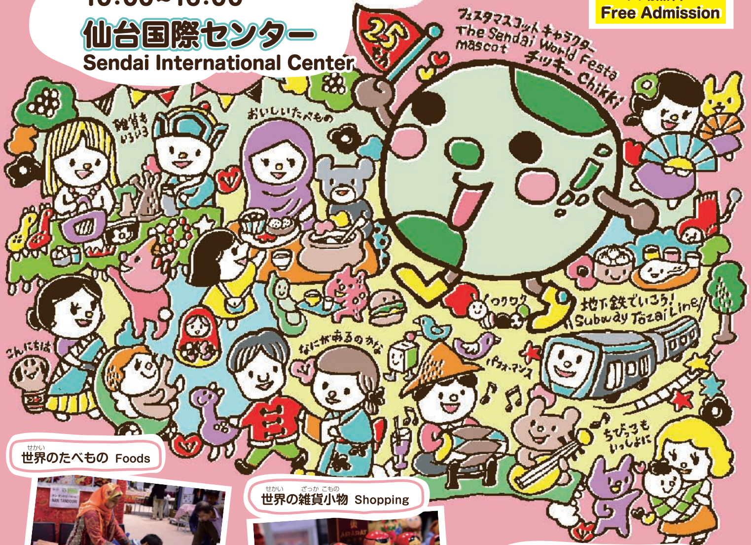
せかい 世界のたべもの Foods